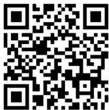
報名網站 QR CODE