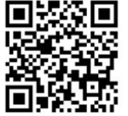
報名網站 QR CODE

◎【111相聲比賽專區】網址 http://app.stps.tp.edu.tw/crosstalk/